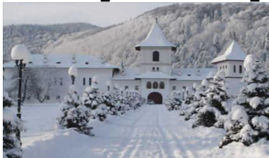
Vizita la Manastirea Brancoveanu